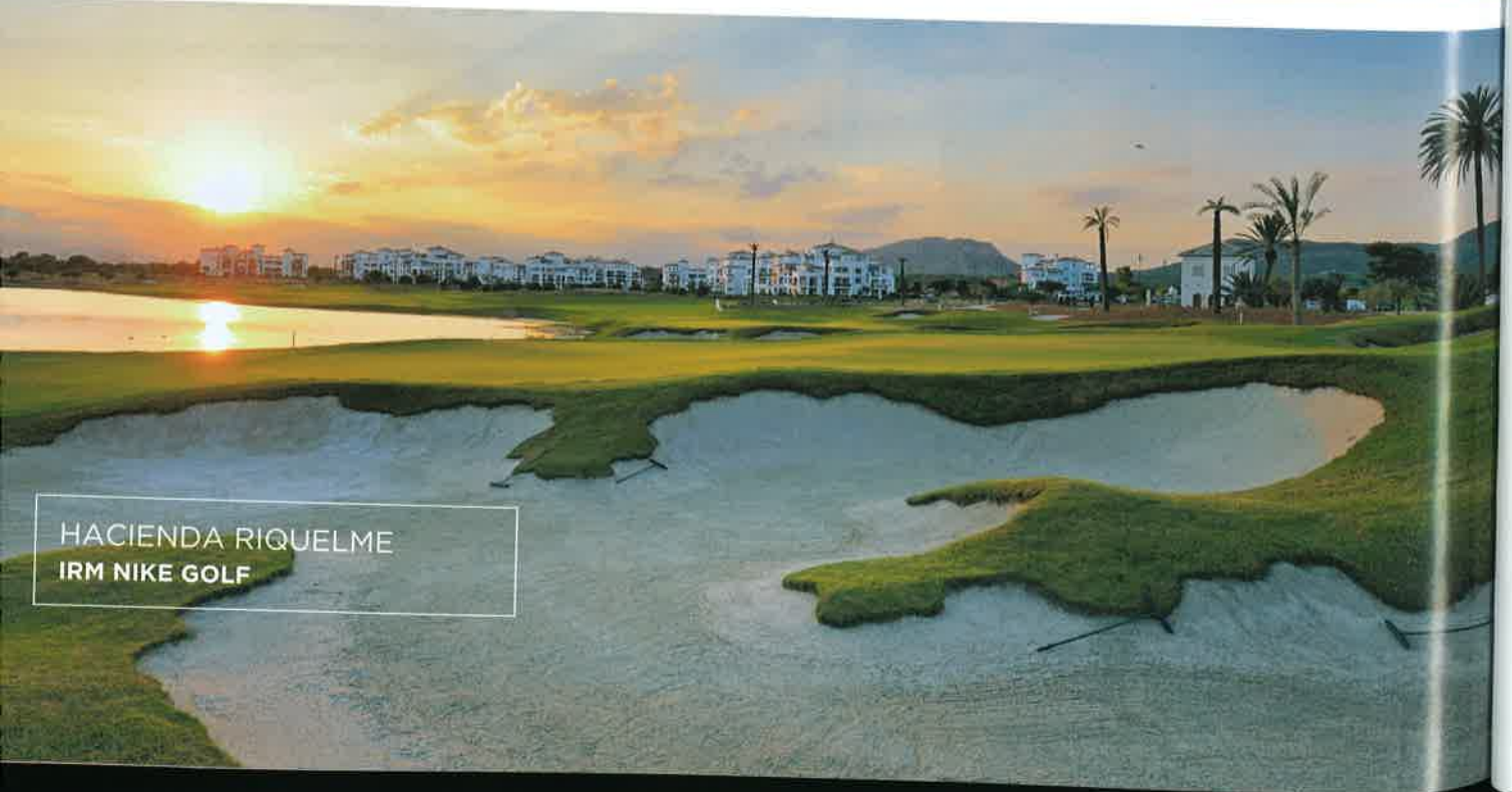
HACIENDA RIQUELME IRM NIKE GOLF

La Manga Club with its 3 golf courses, South, North and West is an exclusive touristic, sport and residential complex located in an extraordinary spot surrounded by nature parks and high quality beaches which offer luxury, sport and leisure. This 560 hectares resort offers a wide variety of accommodation such as the luxury and symbolic five-star Hotel Príncipe Felipe. It is colonial style and it has fantastic views to the golf, swimming pools and gardens. The aparthotel Lomas Village 4* is inspired in Mediterranean villages and it offers fully equipped apartments with views to the complex and next to Spa La Manga Club with its 2,000 m 2 .