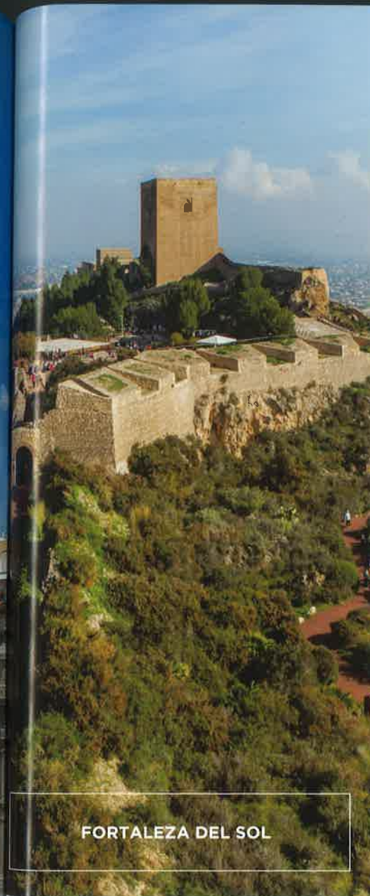
FORTALEZA DEL SOL