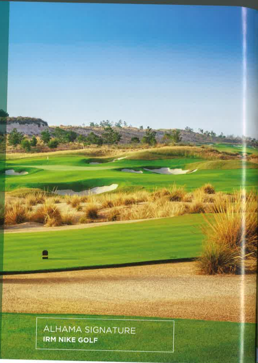
ALHAMA SIGNATURE IRM NIKE GOLF