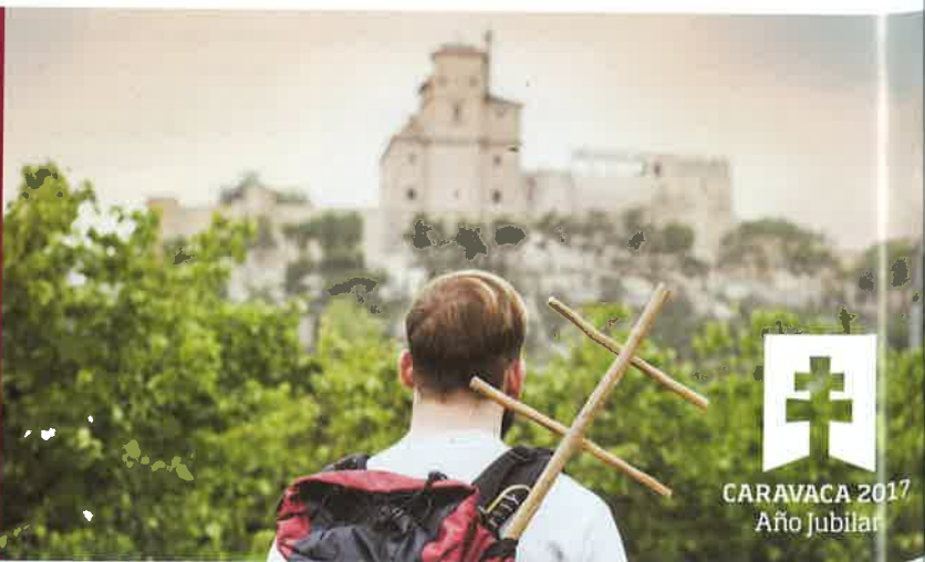
CARAVACA 2017 Año Jubilar